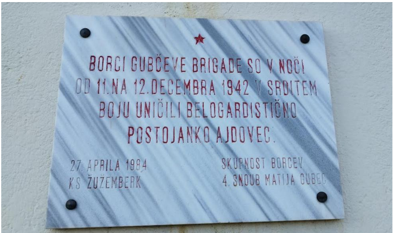
Spominska plošča na stavbi Podružnične šole v Dolnjem Ajdovcu št. 15; plošča je bila 1990 namerno poškodovana in zato nadomeščena z novo, enako prvotni.

Na območju Žužemberka in okolice so delovale vaške straže MVAC. Prostovoljna protikomunistična milica (italijansko Milizia volontaria anticomunista , kratica MVAC; slabšalno bela garda; manj natančno vaška straža) je bila kot slovenska kolaborantska organizacija ustanovljena na področju Ljubljanske pokrajine 6. avgusta 1942 in je bila pod italijanskim poveljstvom.