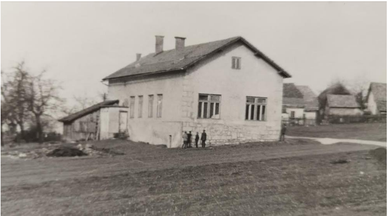
Ajdovec, šola, zgrajena na temeljih prosvetnega doma, ki je bil del postojanke.