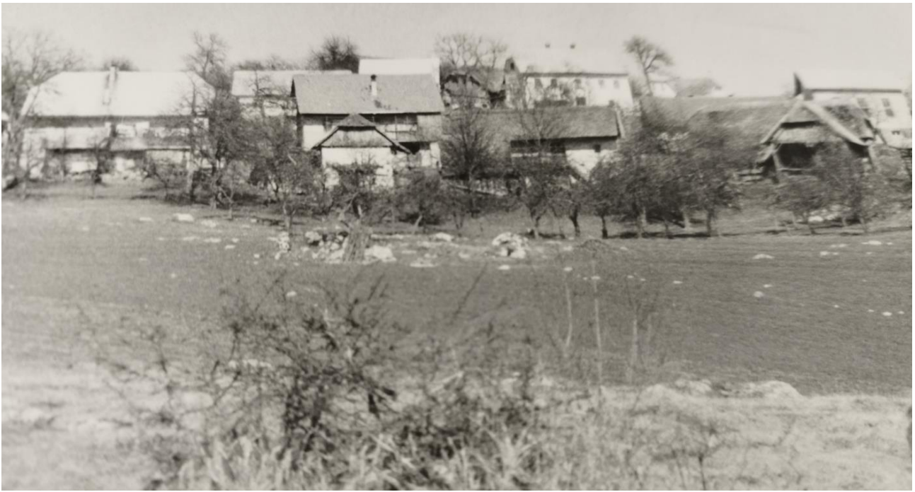
Ajdovec po drugi svetovni vojni.