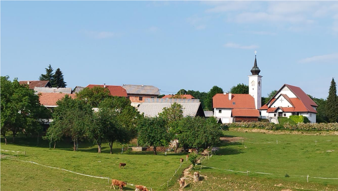
Dolnji Ajdovec danes.