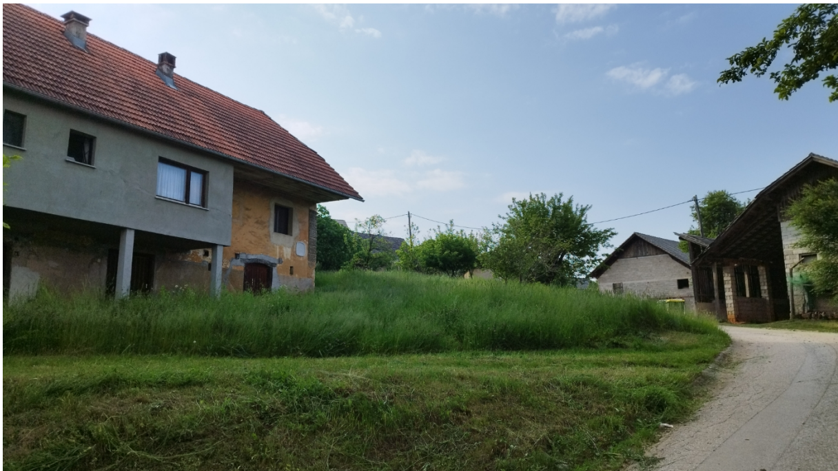
Brezova Reber danes