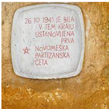
Brezova Reber pri Dvoru 10.