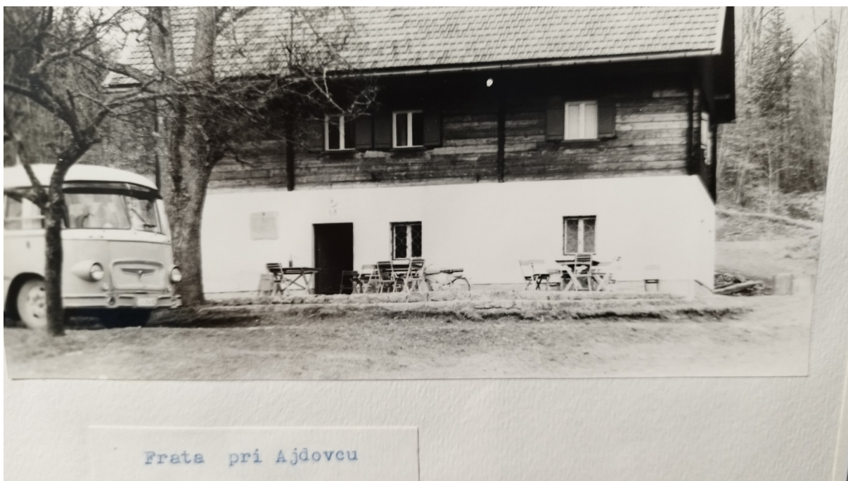
Frata pri Ajdovcu