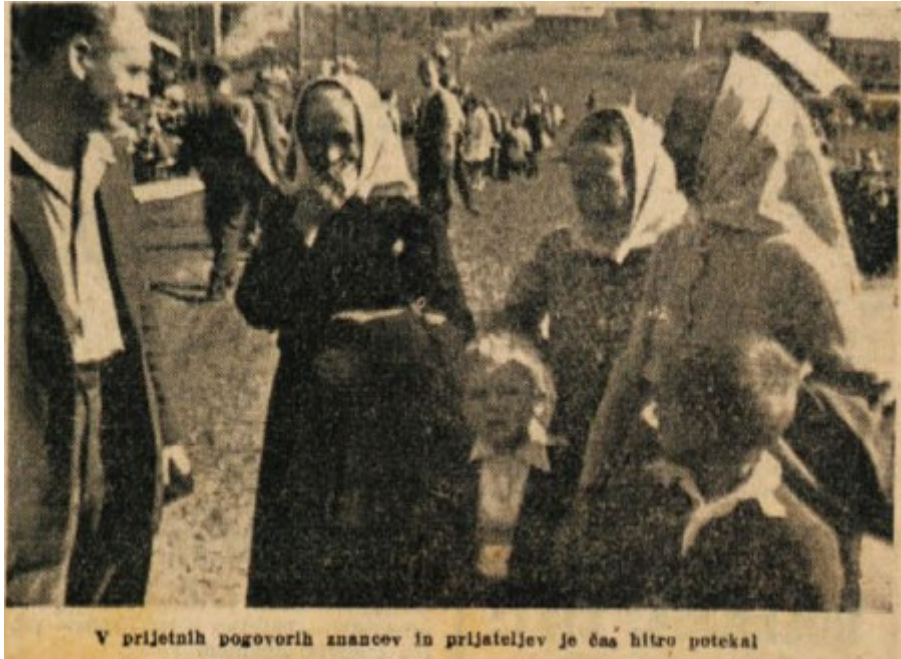
V prijetnih pogovorih znancev in prijateljev je čas hitro potekal