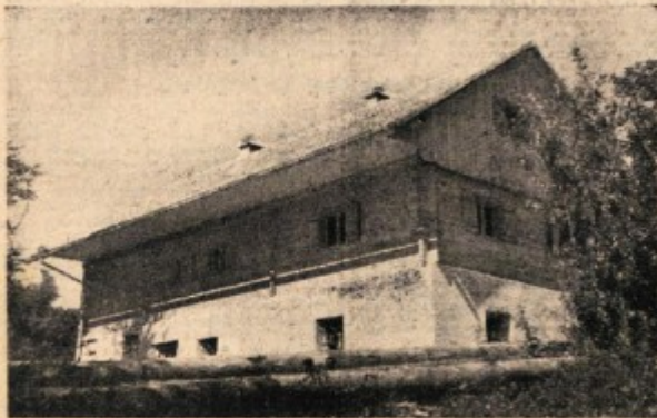
Obnovljena logarnica na Frati, ki bo v soboto 12. septembra 1952 popoldne slavnostno odprta, na njej pa odkrita spominska plošča.