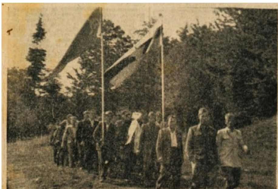
Mogočna četa z Dvora je prikorakala na Frato