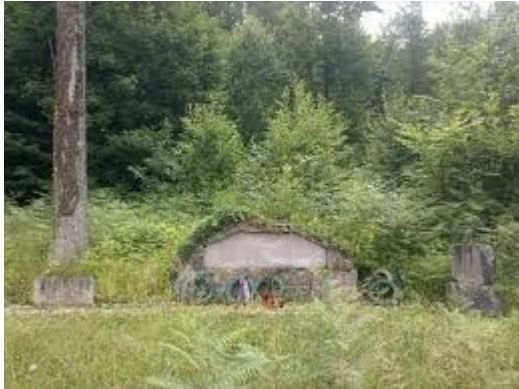
Spomenik na Frati pred obnovo