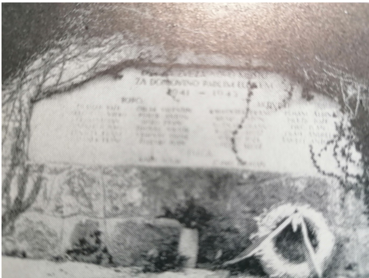
Spominski kamen desno od planinskega doma na Frati z imeni dvanajstih borcev, osmih aktivistov in dveh talcev ter z napisom »Lovska zveza Novo mesto za domovino padlim lovcem 1941-1945«.