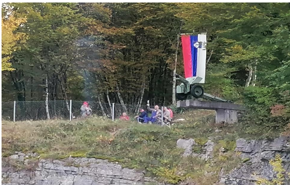
Članice in člani OO ZB za vrednote NOB Žužemberk, dvakrat letno urejamo okolice spomenikov NOB v Občini Žužemberk.