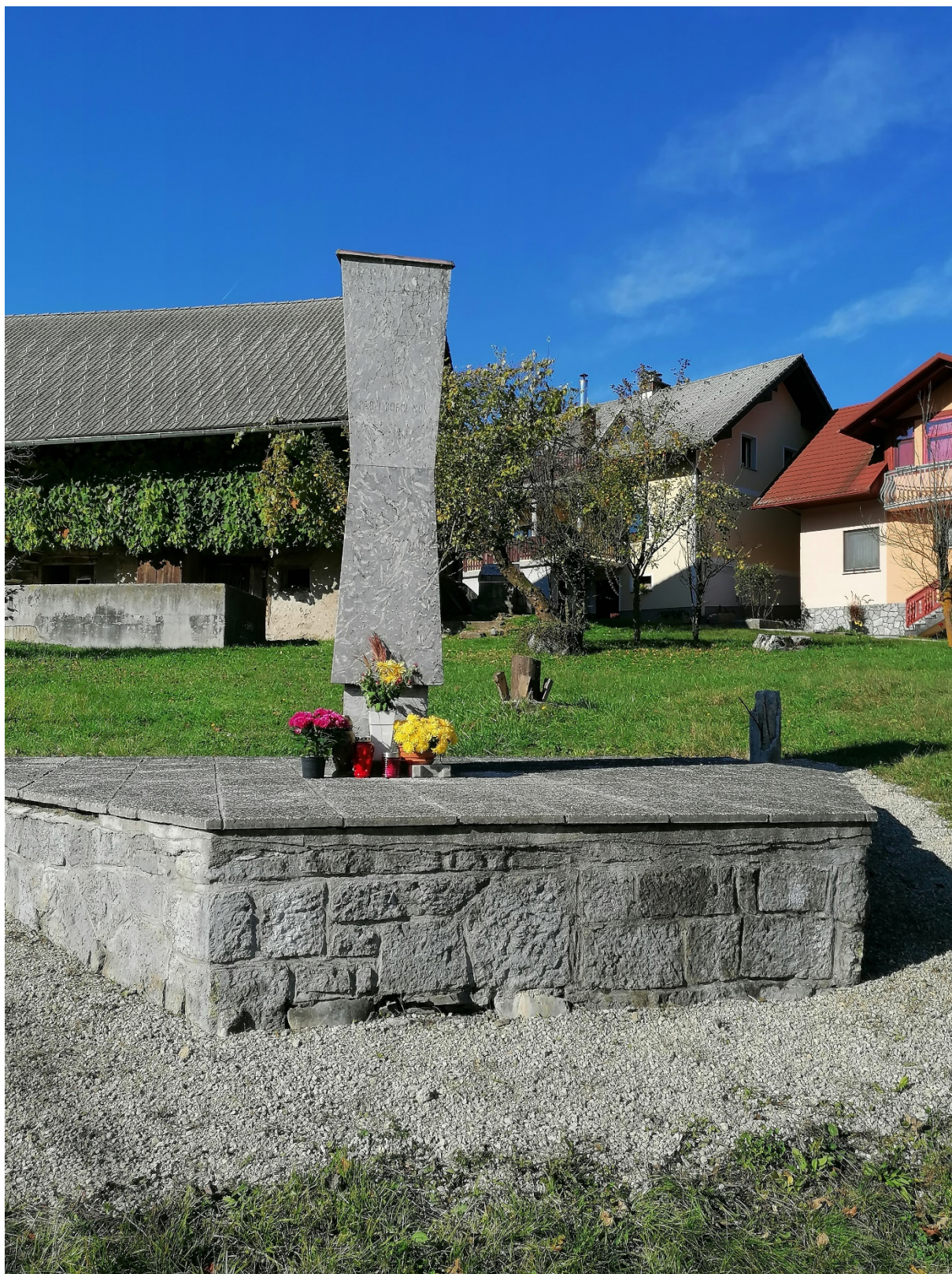
Spomenik na Laščah pri Dvoru danes

OO ZB za vrednote NOB Žužemberk, april 2023