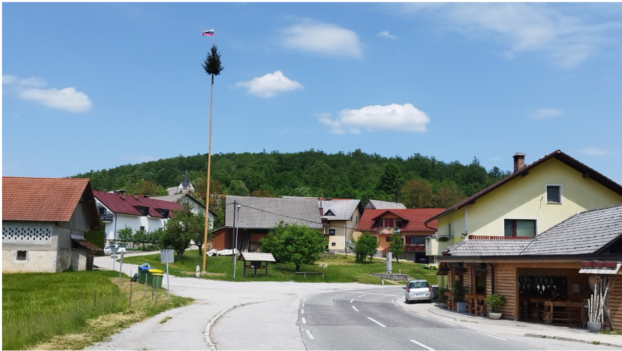
Lašče pri Dvoru danes.