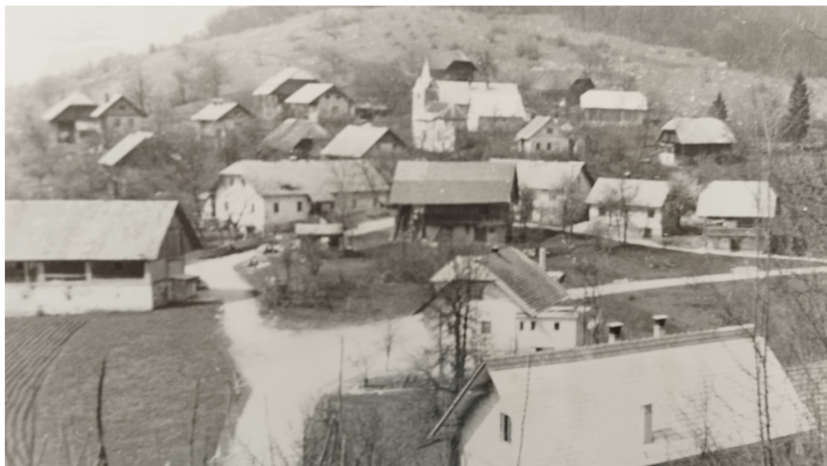
Lašče pri Dvoru po drugi svetovni vojni.

https://www.geopedia.world/#T281_L2518_F2518:4069_x1663240.7533083956_y5749511.4029886_12_s12_b362