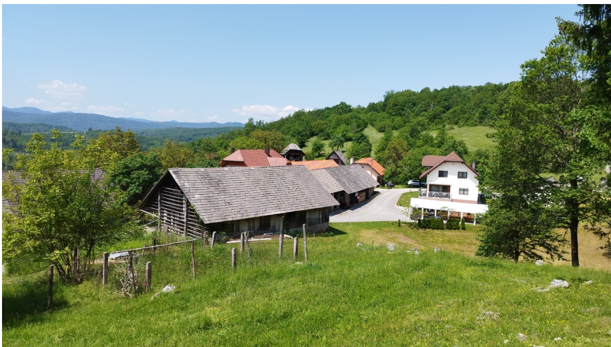
Plešivica pri Žužemberku danes