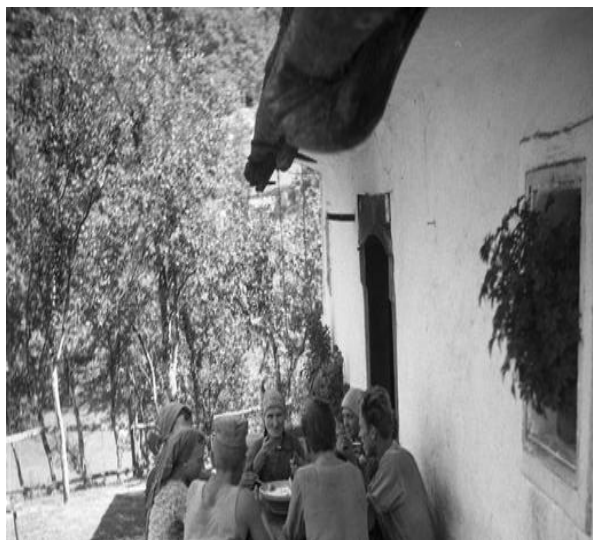
Družina pri jedi za kamnito mizo.