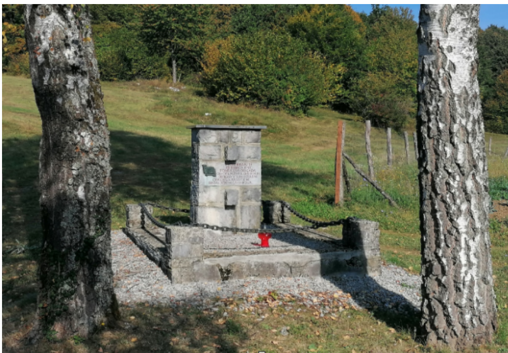
Spomenik na Plešivici danes

OO ZB za vrednote NOB Žužemberk, april 2023