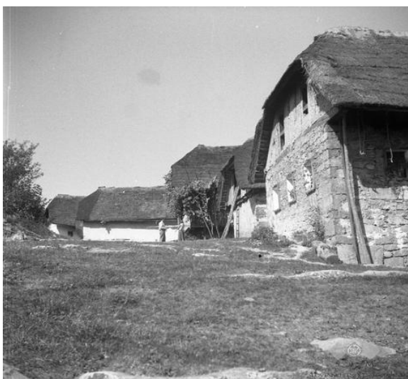
Hiše na Plešivici.