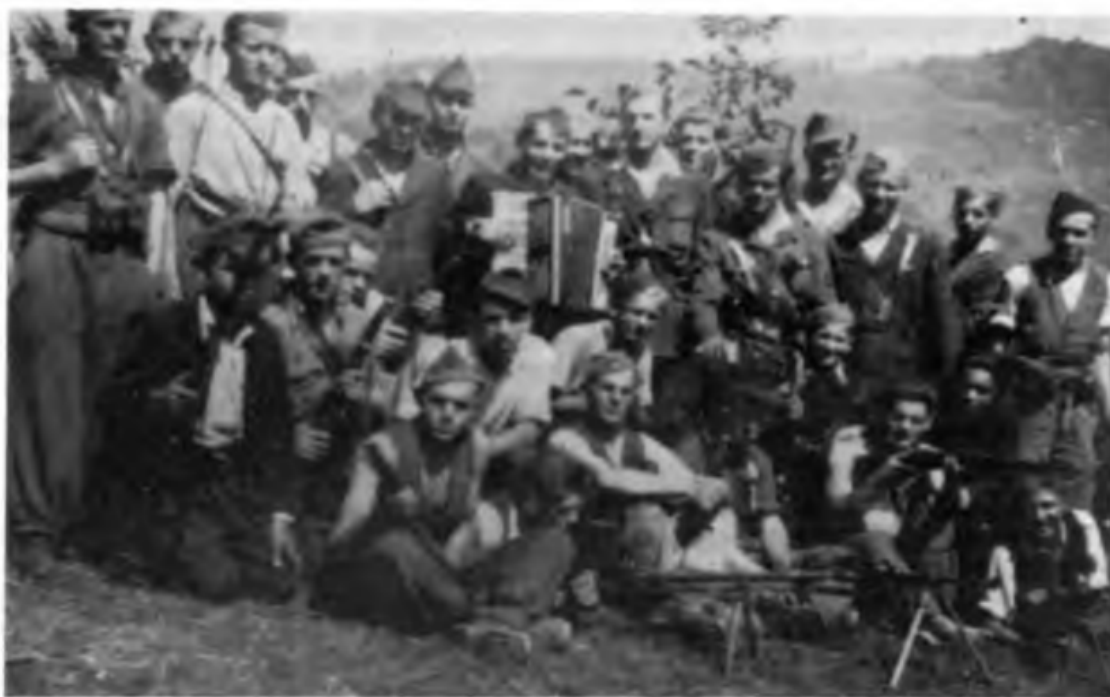
Četa 2. bataljona Gubčeve brigade na Stari gori pri Trebelnem avgusta 1943