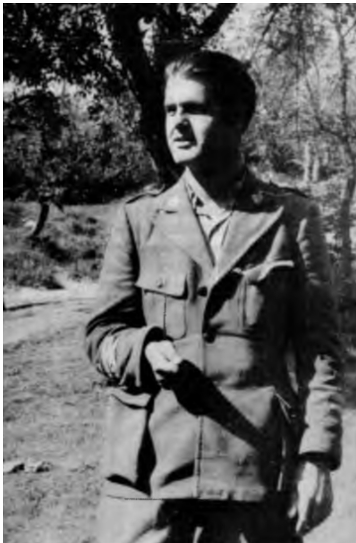
Rajko Tanasković , prvi komandant 7. korpusa

7. korpus je bil največja partizanska enota na slovenskih tleh; spomladi 1944 je štel okoli 25 000 bork in borcev. Ko je aprila 1945 dobil povelje za napad na Ljubljano, je korpus štel le še 11 853 borcev. Od ustanovitve je v bojih padlo nad 3000 borcev, več kot 6000 jih je bilo ranjenih.