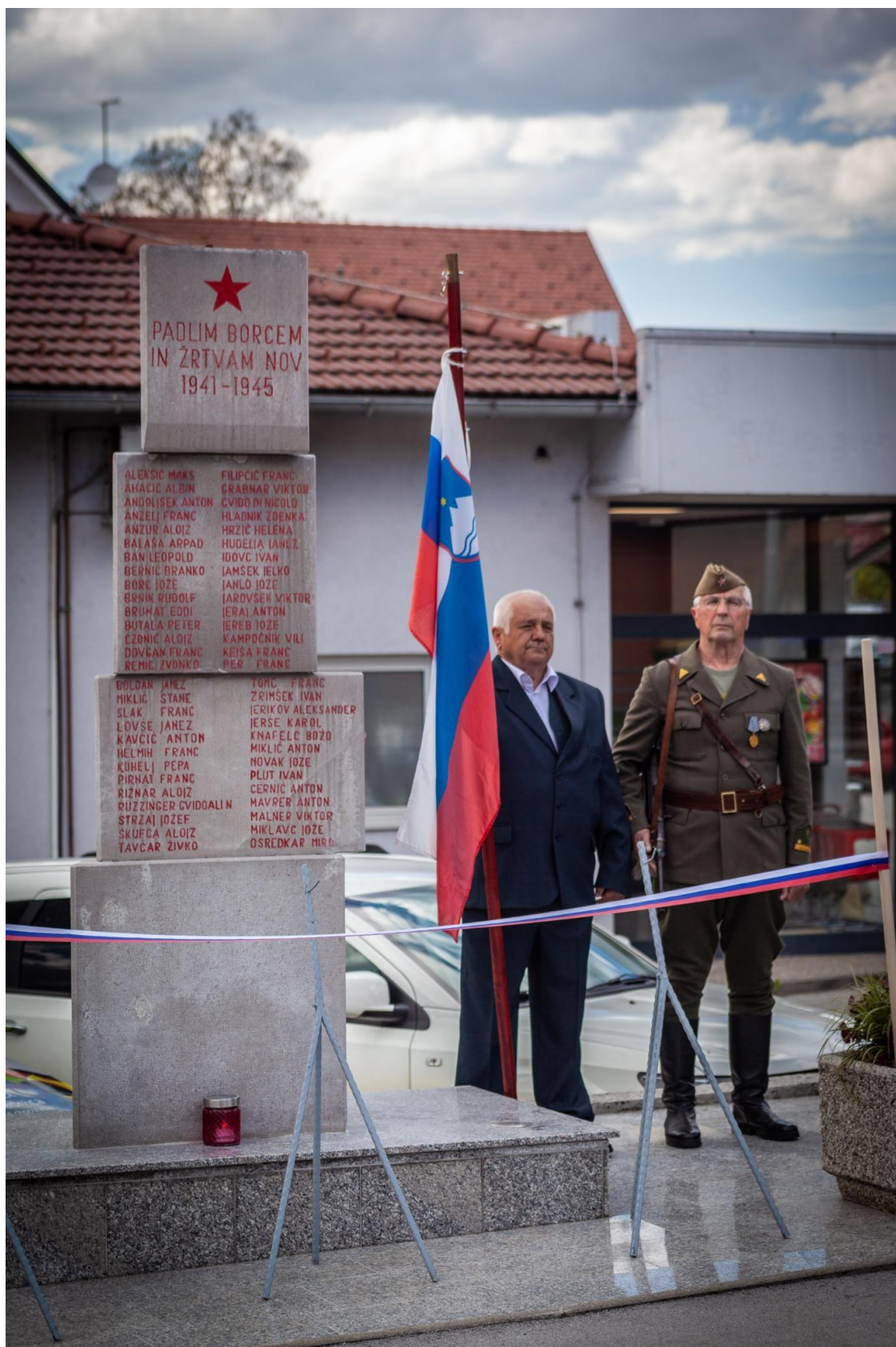
Zastavonoša in častna straža člana spominske Novomeške čete