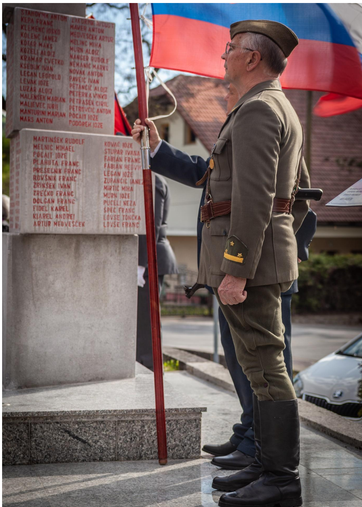
Na spomeniku je vklesanih 156 imen padlih in drugih žrtev fašizma in nacizma med narodnoosvobodilno vojno 1941–1945.