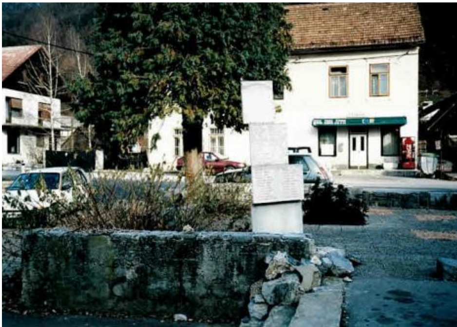
Spomenik, preden so ga zaradi obnove križišča skozi Dvor prestavili na drugo lokacijo