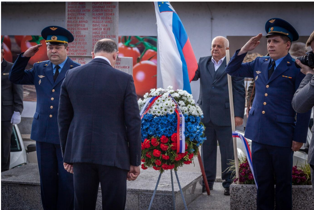
Venec k spomeniku NOB je položil veleposlanik Ruske federacije v RS, njegova ekscelenca Timur Eyvazov.