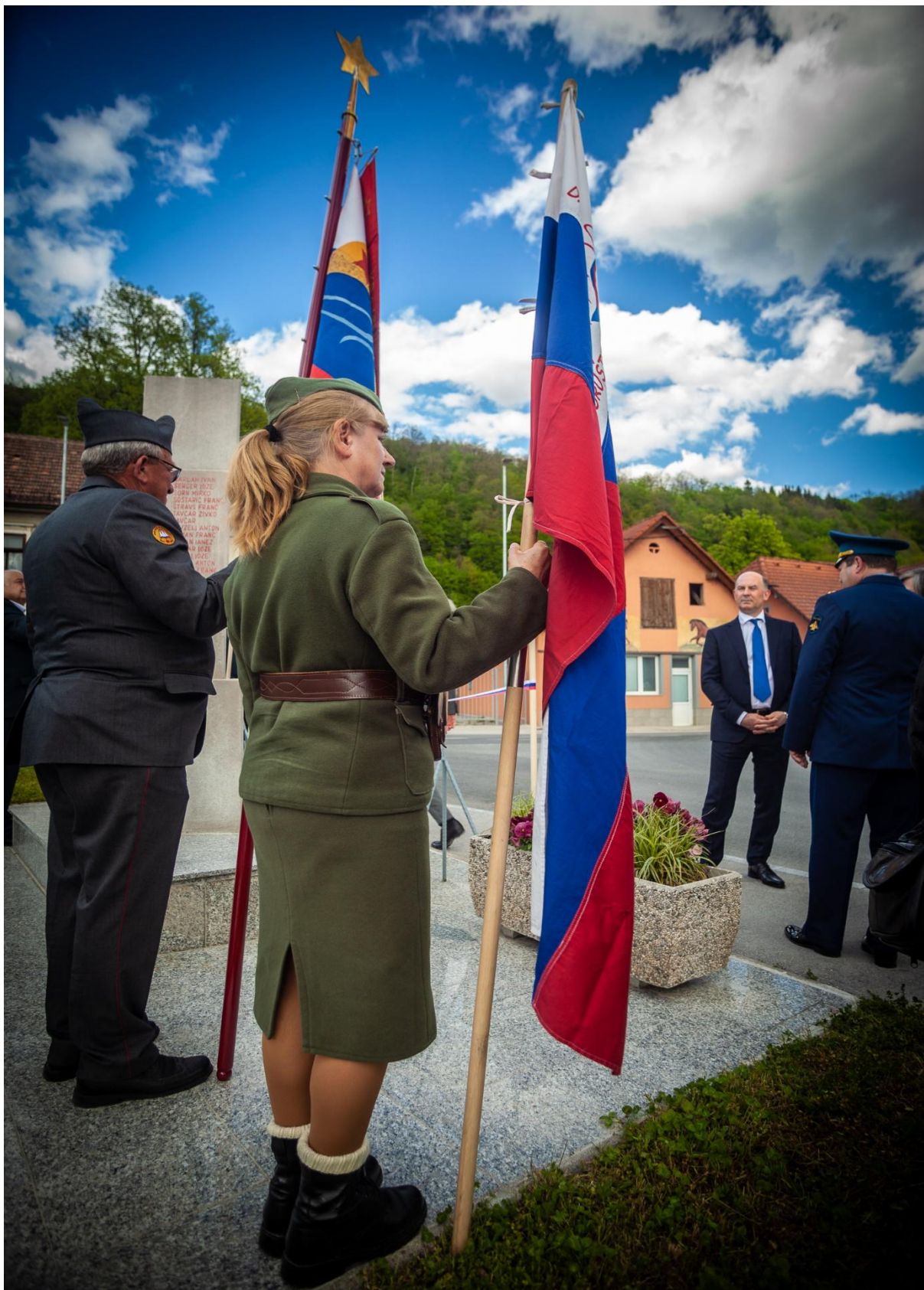
Praporščak in častna straža članice spominske Novomeške čete