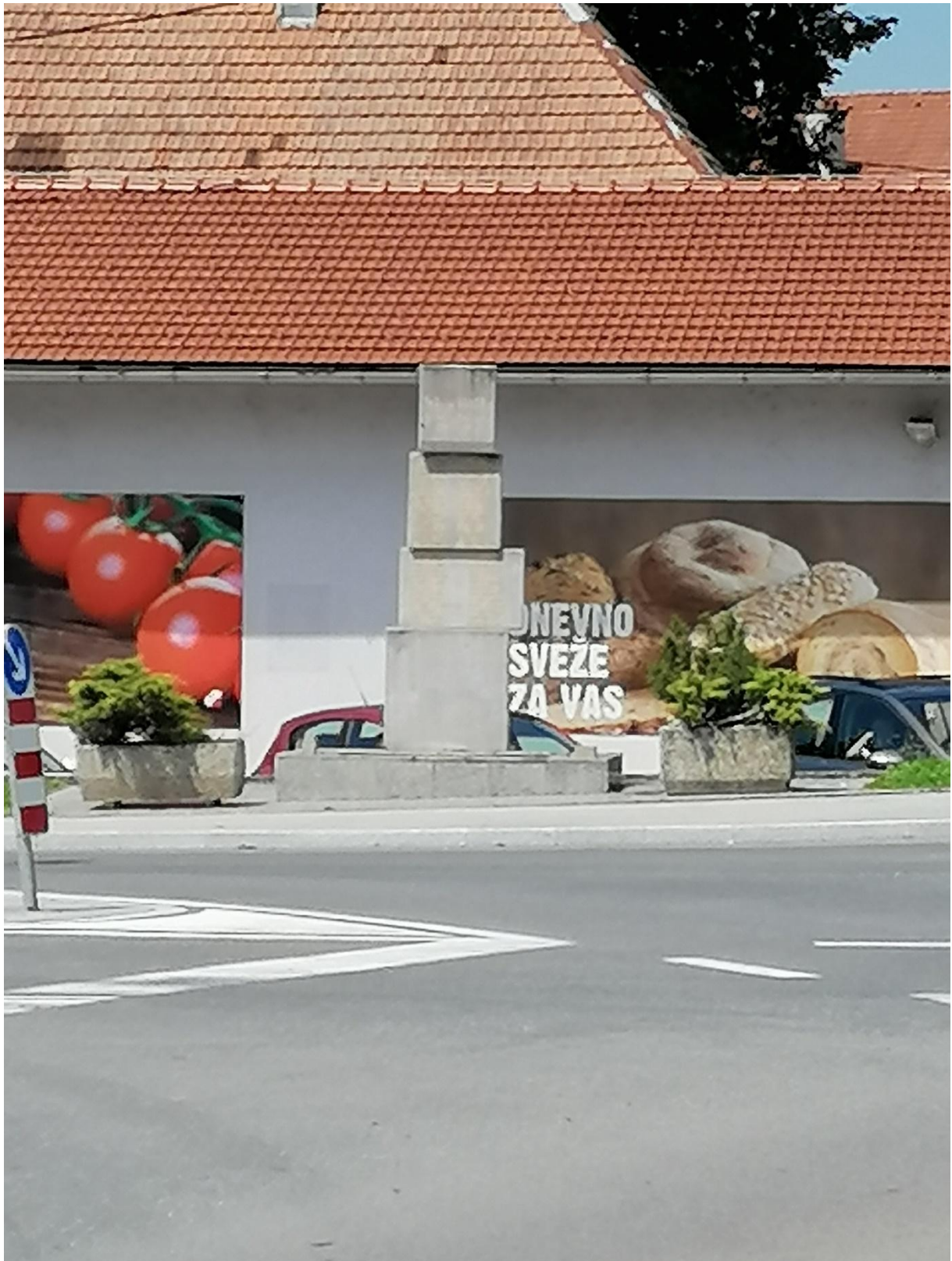
Spomenik NOB na Dvoru pred obnovo, oktober 2020