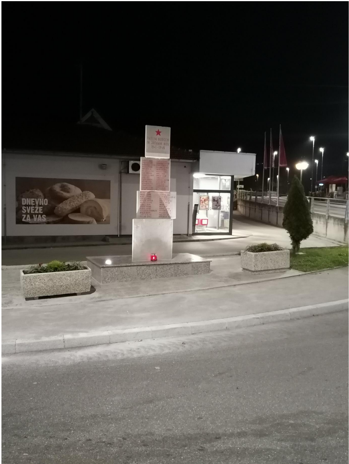
Spomenik NOB na Dvoru po obnovi, oktober 2020