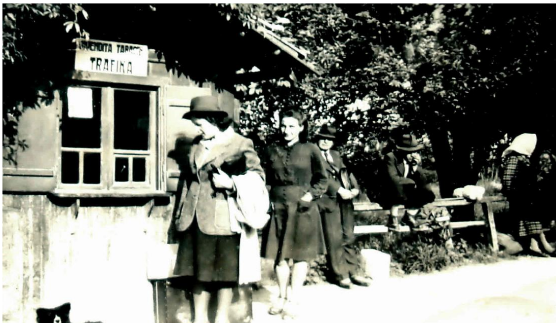
Na mestu, kjer danes stoji obnovljeni spomenik, sta bili pred 2. svetovno vojno trafika (kiosk) in "vaga" (tehtnica) trgovca Možeta.