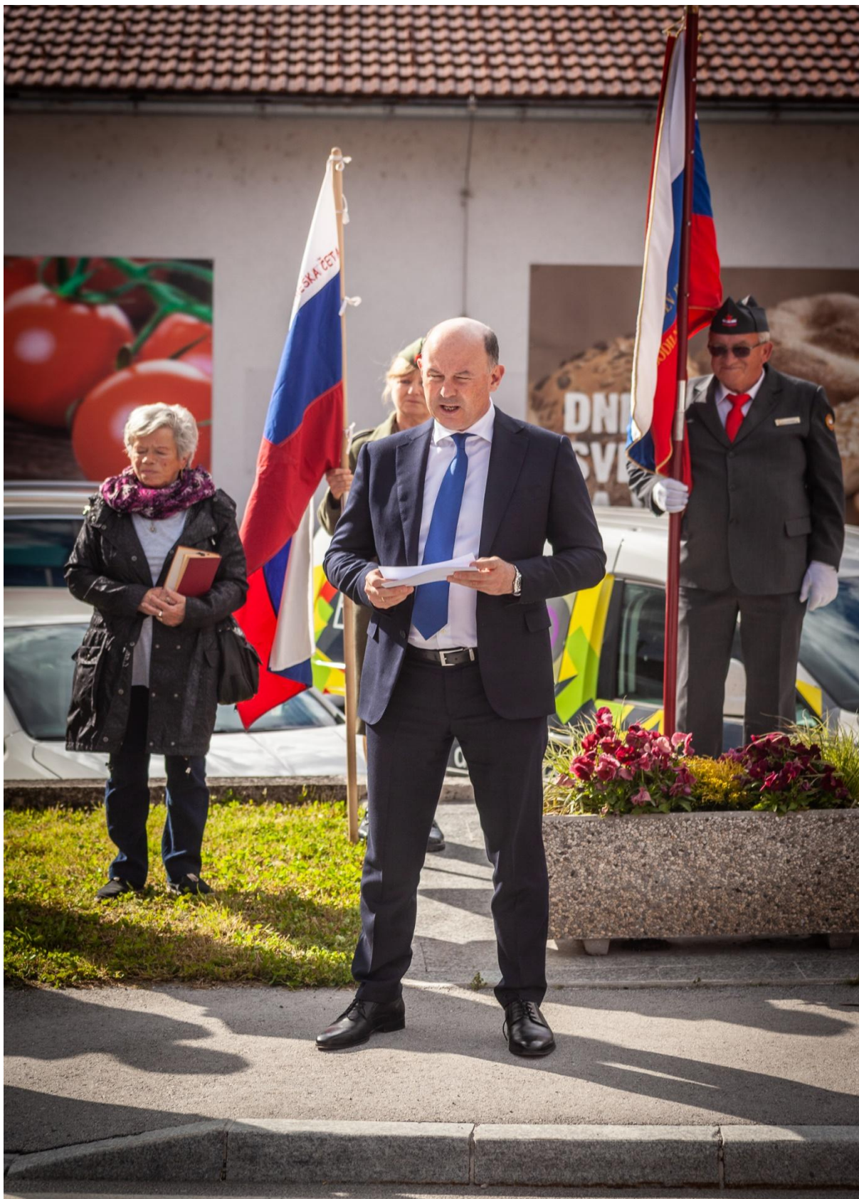
Njegova ekscelenca Timur Eyvazov, veleposlanik Ruske federacije v RS