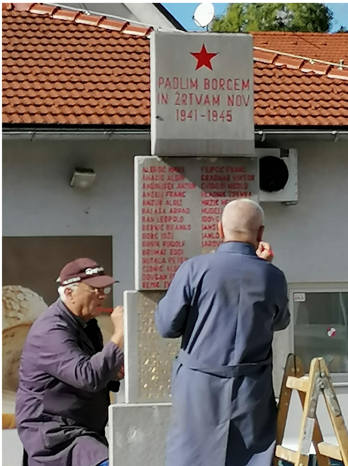
Obnova spomenika NOB, oktober 2020