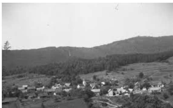
Stavča vas pred 2. svetovno vojno

https://www.geopedia.world/?locale=sl#T281_L2518_F2518:5657_x1668372.3182201541_y574983_4.650382683_s14_b362