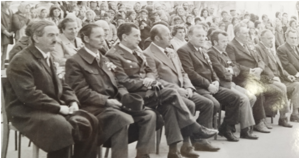
Borci jurišnega bataljona XV. divizije na proslavi ob 30. obletnici osvoboditve, ki je bila 1. maja 1975 na trgu v Žužemberku