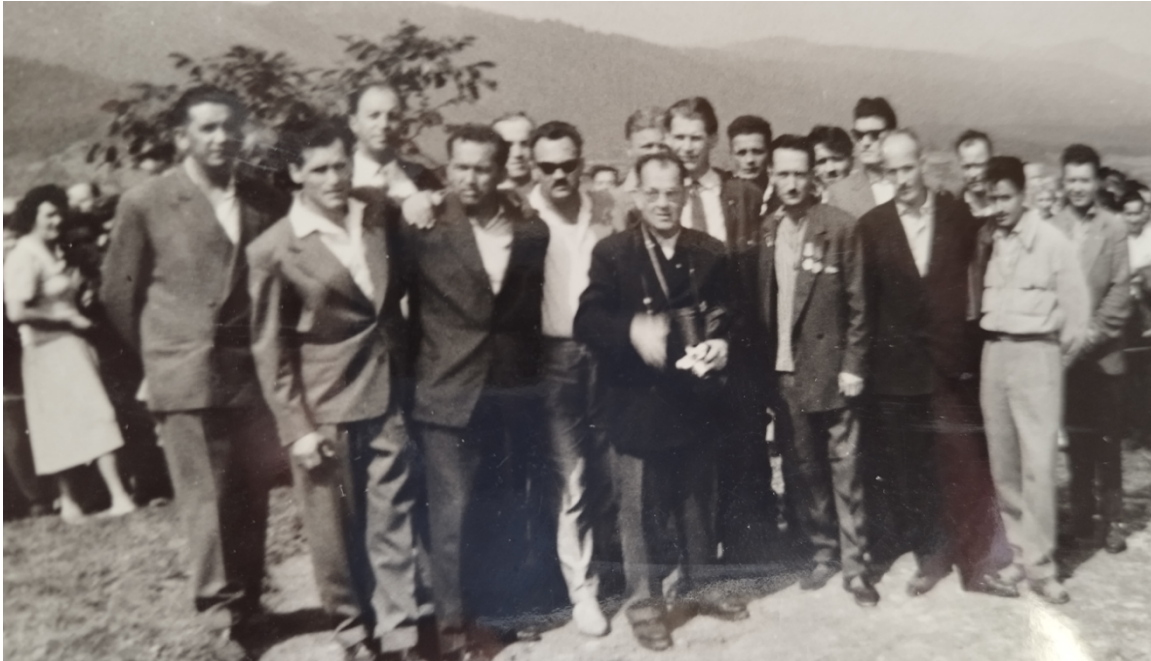
Borci jurišnega bataljona XV. In XVIII. divizije na otvoritvi spomenika NOB na Cviblju