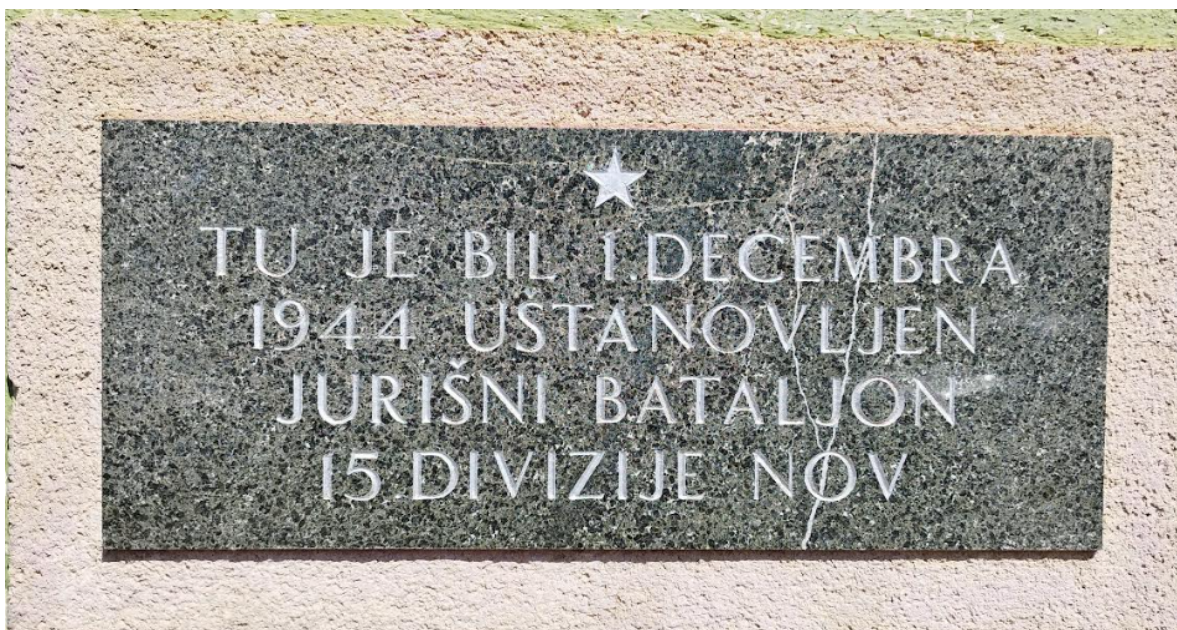
Spominsko obeležje v Stavči vasi, kjer je bil 1. decembra 1944 ustanovljen jurišni bataljon XV. divizije, je vzdal odbor jurišnega bataljona.

1 Slovensko domobranstvo (nemško Slowenische Landwehr , kratica SD) je bila policijsko-paravojaška formacija, ki jo je na pobudo predstavnikov slovenskih predvojnih političnih strank septembra 1943 ustanovila in z orožjem ter ostalo opremo oskrbovala nemška uprava na področju bivše Ljubljanske pokrajine (to so Nemci zasedli po kapitulaciji Italije). Domobranska vojska je imela ločen slovenski in nemški štab; slednji je bil pomembnejši in je bil podrejen generalpolkovniku SS in poveljniku policije Erwin Rösenerju, ki je neposredno poročal poveljniku SS, Heinrichu Himmlerju. Domobranci so oborožili, oskrbovali in plačevali Nemci.