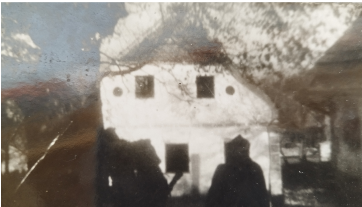
Napad jurišnega bataljona XV. divizije na Vinkov Vrh (fotografija med bojem)