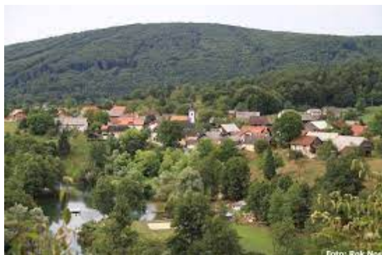
Stavča vas po 2. svetovni vojni

Kot navaja Lado Ambrožič - Novljan v svoji knjigi »Petnajsta divizija«, naj bi se zamisel o posebnih enotah z veliko ognjeno močjo in manevrsko sposobnostjo porodila v drugi polovici leta 1944 v Glavnem štabu NOV in POS. Sprejetju takšne odločitve so botrovale razmeroma slabe izkušnje na