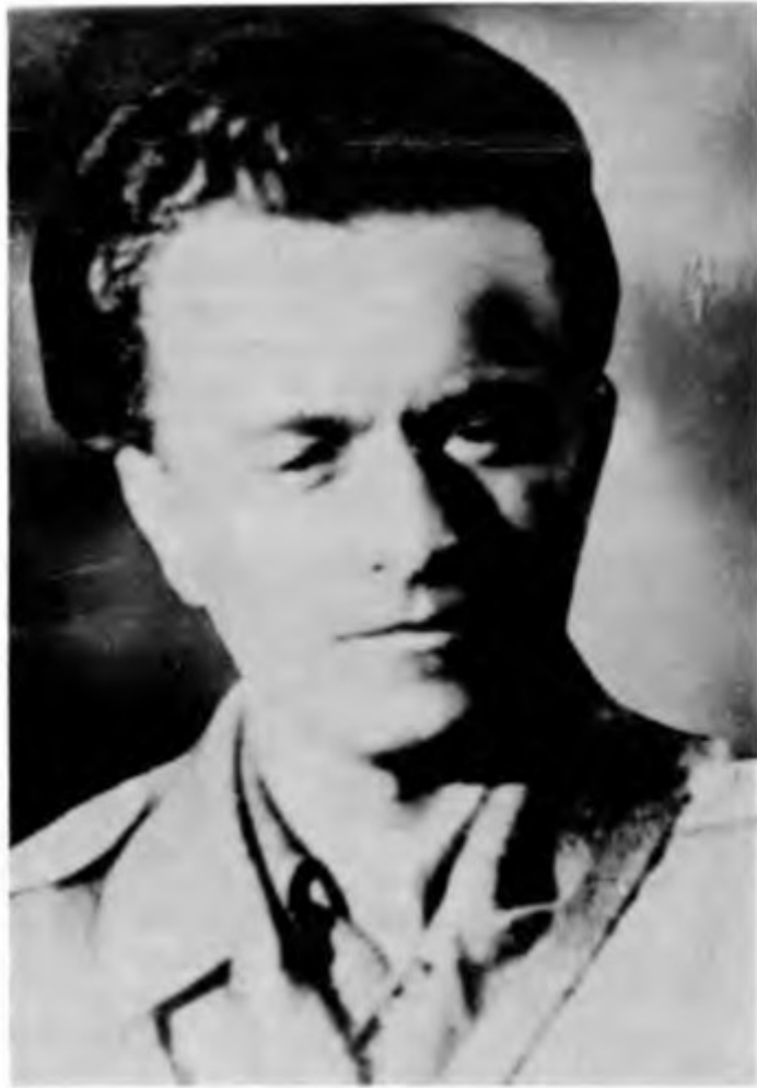
Milovan Šaranović, načelnik glavnega štaba NOV in POS