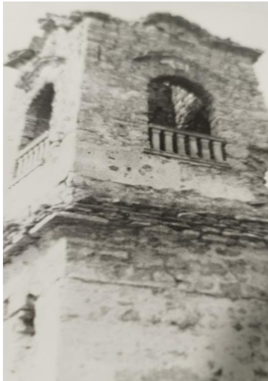
Cerkveni stolp – mitralješko gnezdo

Italijani vdrli v Žužemberk. Napad na Žužemberk se ni posrečil. Prvi partizanski napad na Žužemberk je odprl vrsto čedalje močnejših napadov, ki so v zgodovini narodnoosvobodilne vojne zavzemali zelo vidno mesto. Izdajalski belogardizem, ki pri prvem poskusu ni bil iztrebljen, je zaplodel mrežo umazanega sodelovanja z vsemi okupatorji ter zločinske dejavnosti proti lastnemu narodu, ki jim težko najdemo enake na vsem slovenskem. Žužemberk je še mnogokrat srečal Gubčevo brigado in njene borce, ki so se zmeraj zelo trudili, da bi ga osvobodili.