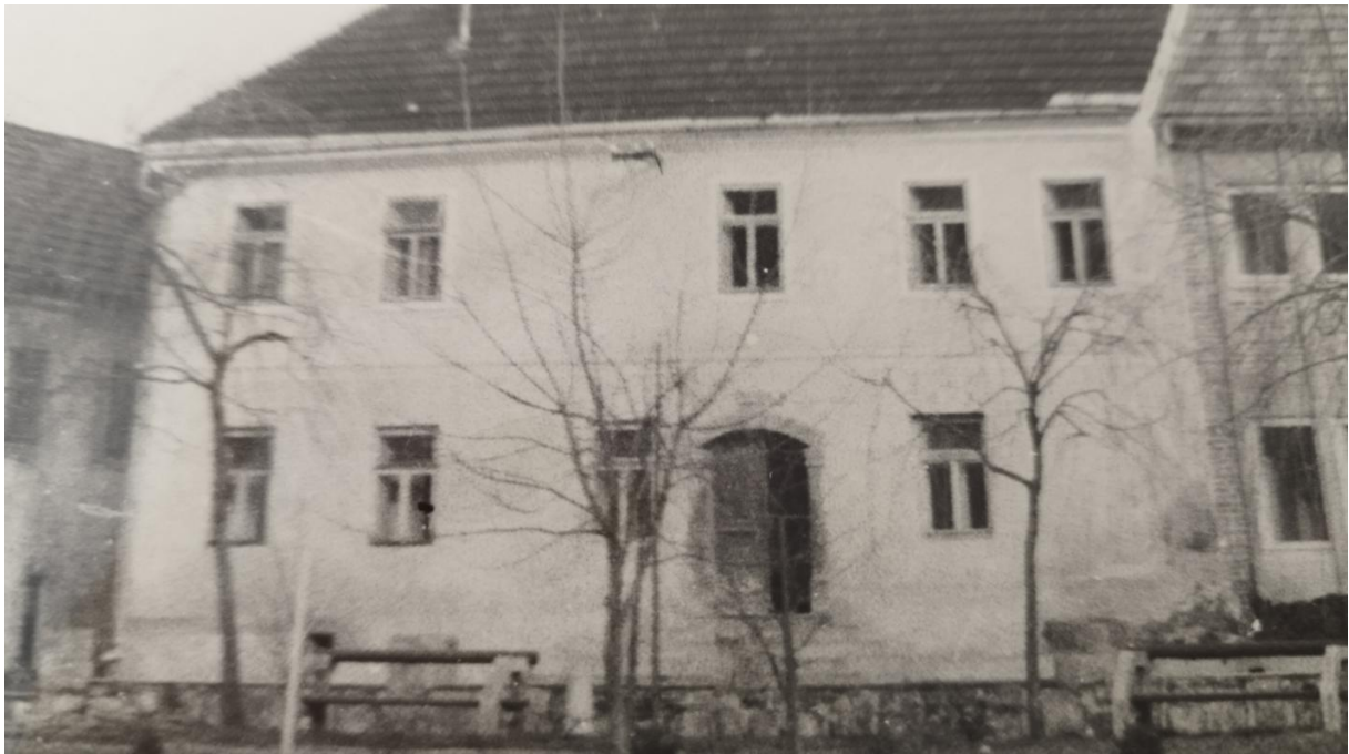
Hiša na trgu, v kateri je bila karabinjerska postaja

V Žužemberku so sovražnika prvič videli 13. aprila 1941. Takrat se je skozi kraj pomikala proti Novemu mestu prva italijanska motorizirana in kolesarska enota, vendar se italijanski vojaki takrat še niso naselili v Žužemberku. V hiši na trgu so se naselili le karabinjerji z enim orožnikom.