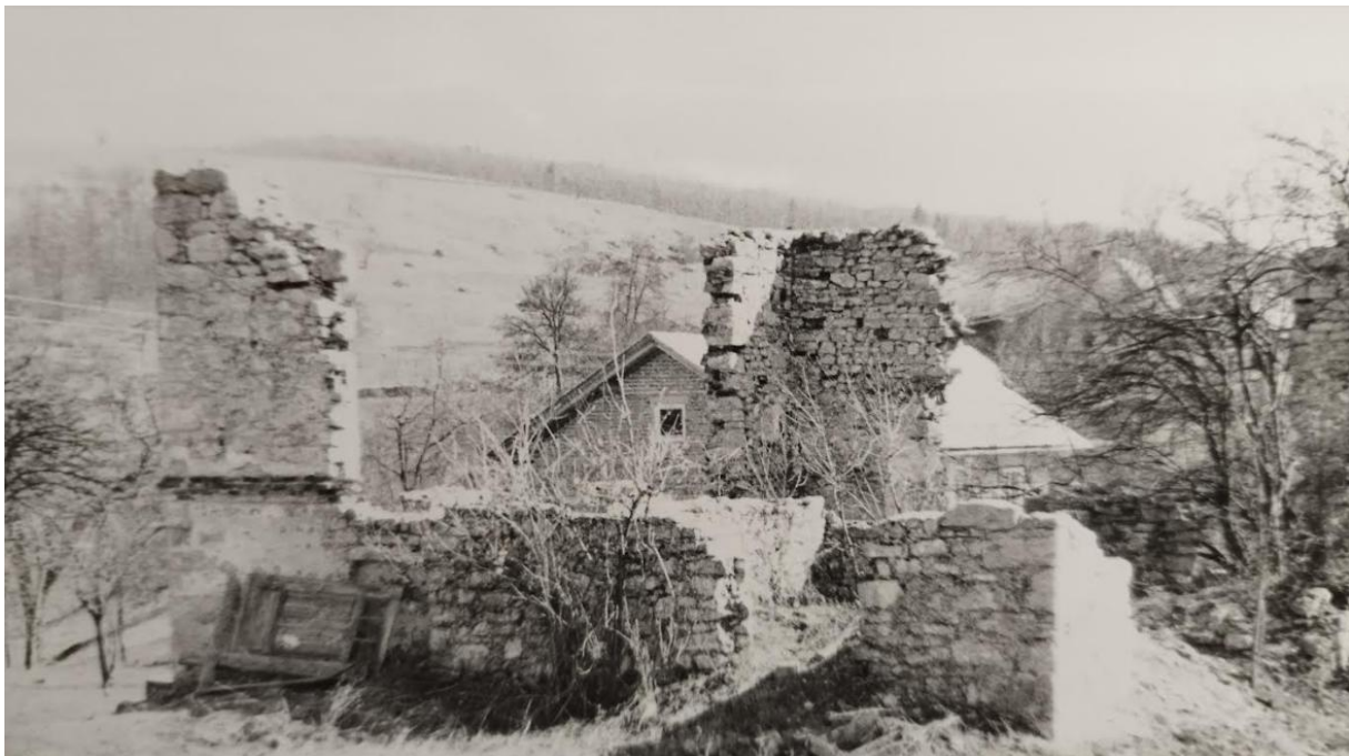
Ostanki postojanke v Ajdovcu

Oktober se je okupator skrbno zavaroval v Žužemberku, poleg tega pa je postavil postojanke še v Ajdovcu, Selih pri Šumberku in v Hinjah. Žužemberško postojanko je ojačal z močnim oddelkom belogardistov, v katerem so bili večinoma domačini in okoličani. Nastanjeni so bili v bivši posojilnici (gostilna). Vse to je oviralo partizansko premikanje po Suhi krajini. Gubčeva brigada je zato začela s sistematičnem čiščenjem sovražnikovih postojank.