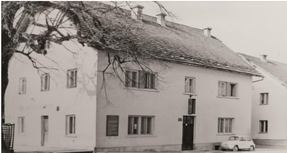
Bivša posojilnica na trgu

Med domače plačance so razdelili orožje.