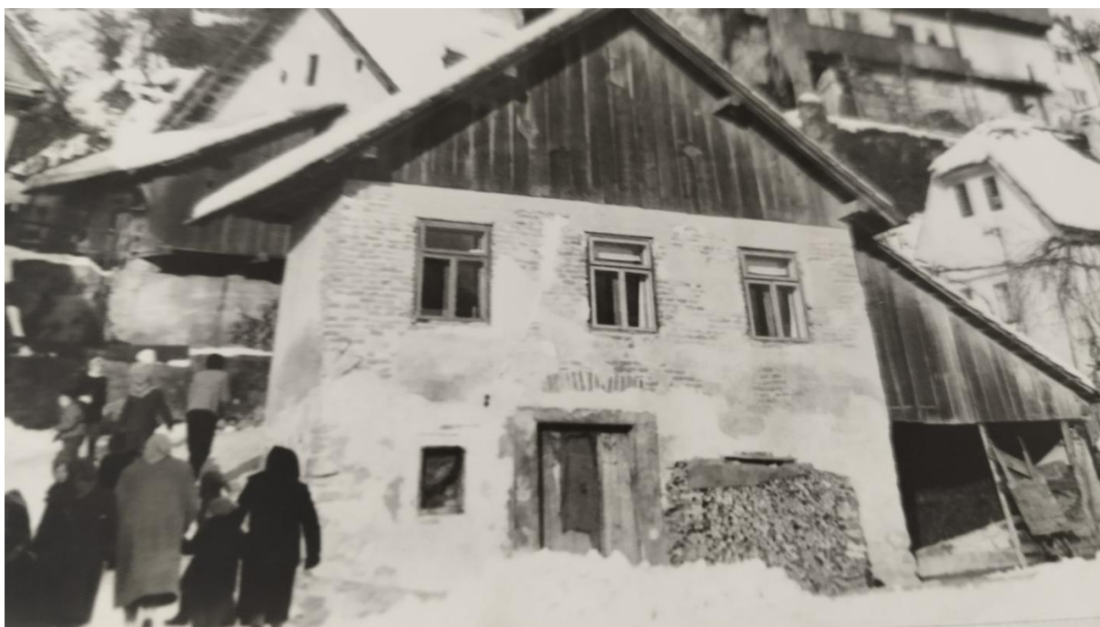
Žužemberk – Breg