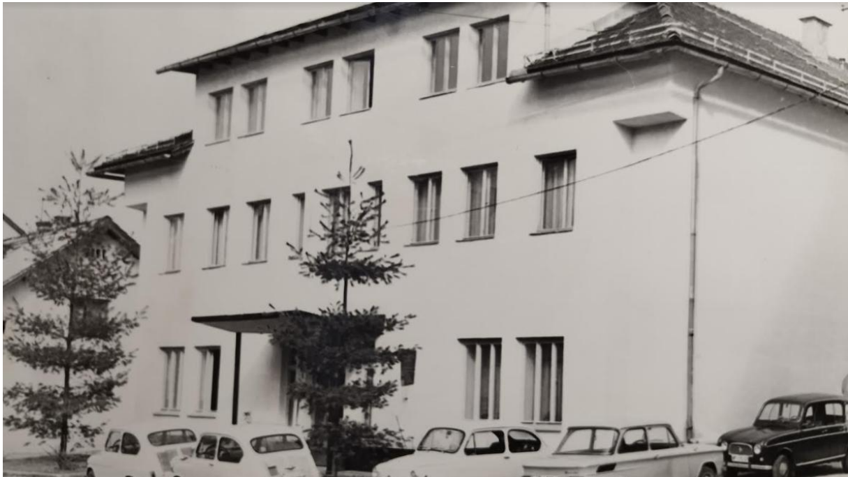
Sodišče – po vojni obrat Iskre

Vir: Škufca, J., Kocijan L. in Bregar M., Spomenik narodnoosvobodilne vojne pri Žužemberku, Novo mesto, Zveza združenj borcev za vrednote NOB, območni odbor, 2007