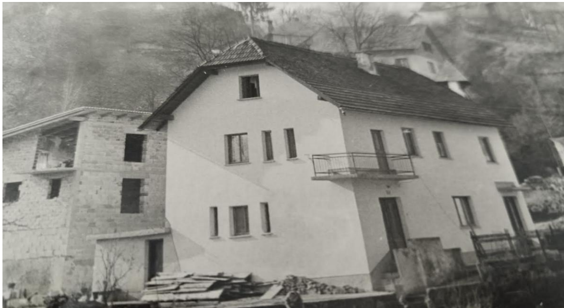
Smrketova hiša pri mostu v Žužemberku

večkrat kolone vojakov. Včasih so za nekaj časa ostali, vendar so kmalu odšli.