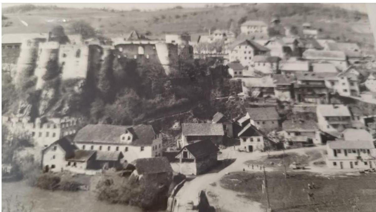
Žužemberk – levi breg

Žužemberk je cestno križišče, zato je bil med 2. svetovno vojno pomembna strateška točka. Leži v Gornjekrški dolini. Reka Krka ga deli na dva dela, ki ju povezuje most. Hribi, ki ga obkrožajo, so Gradenška gora, Plešivica, Lisec in Sveti Peter na Rogu. Ljudstvo je bilo revno, preživljalo se je predvsem z živinorejo in priložnostnim zaslužkom. Precej jih je šlo tudi v tujino iskat delo in zaslužek. V samem