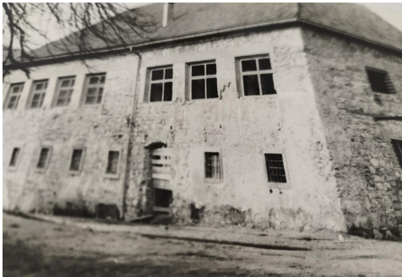
Grajska kašča med obnovo