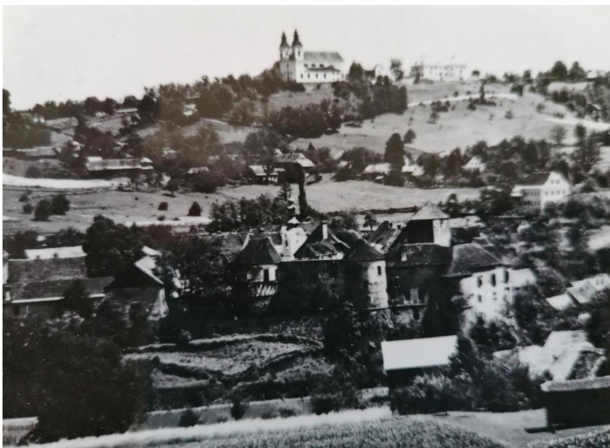
Žužemberk pred 2. svetovno vojno