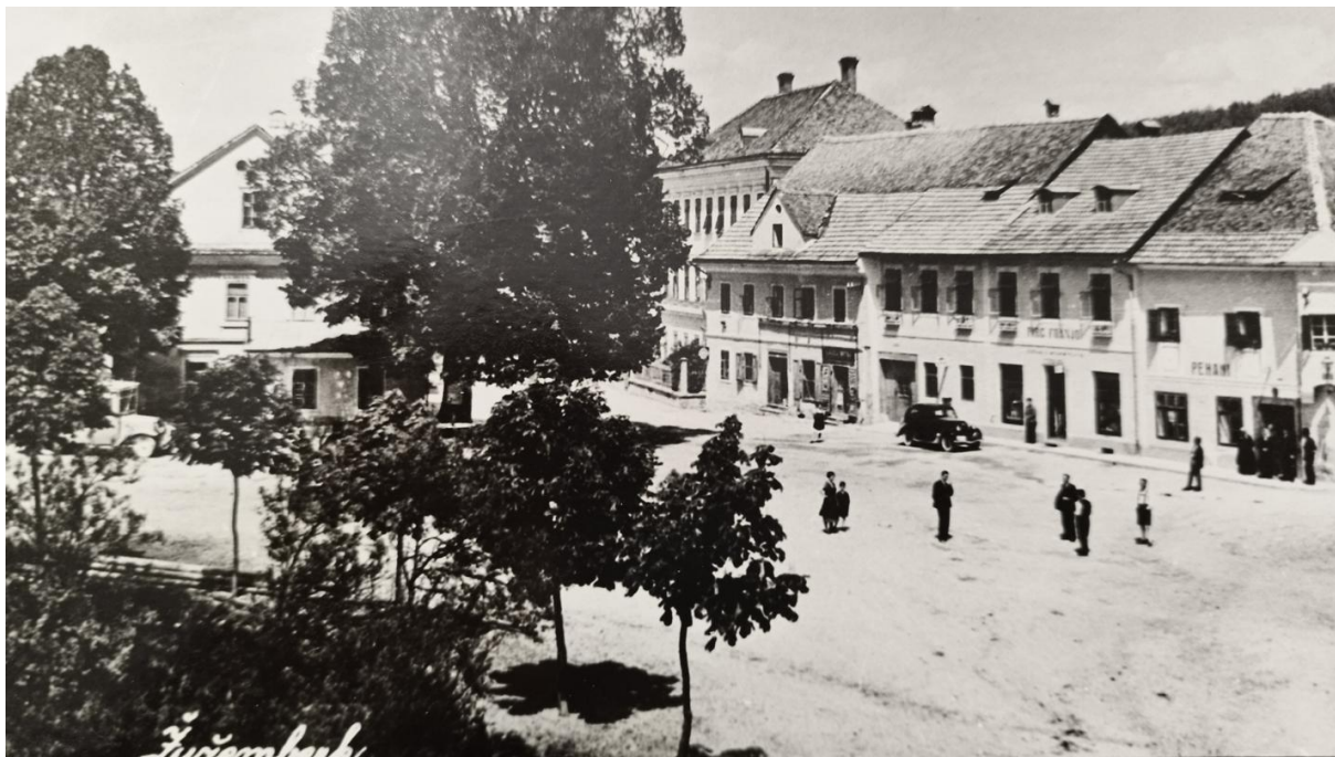
Žužemberk – trg