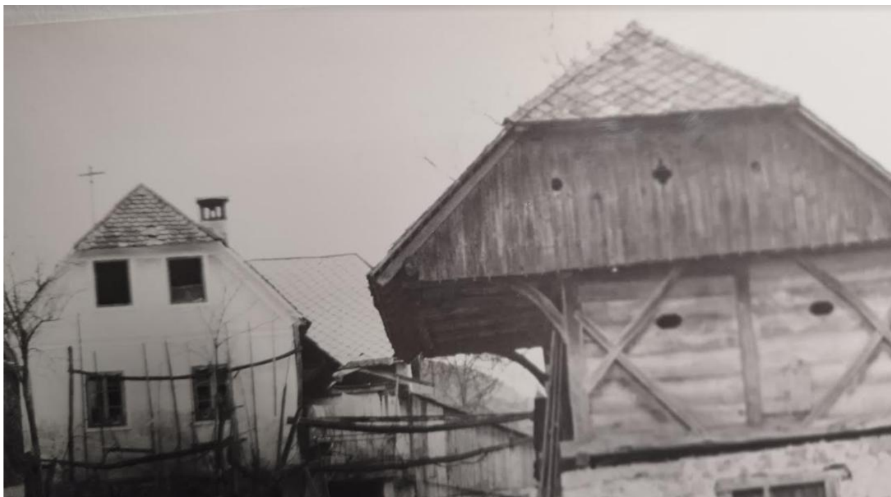
Kovaški delavnici sta bili pri Slavku Žlajpahu in v grajskem stolpu poleg grajske kašče.

Usnjarna je redno obratovala pod upravo mestnega poveljstva; vodil jo je Kalčič iz Šmihela pri Novem mestu.