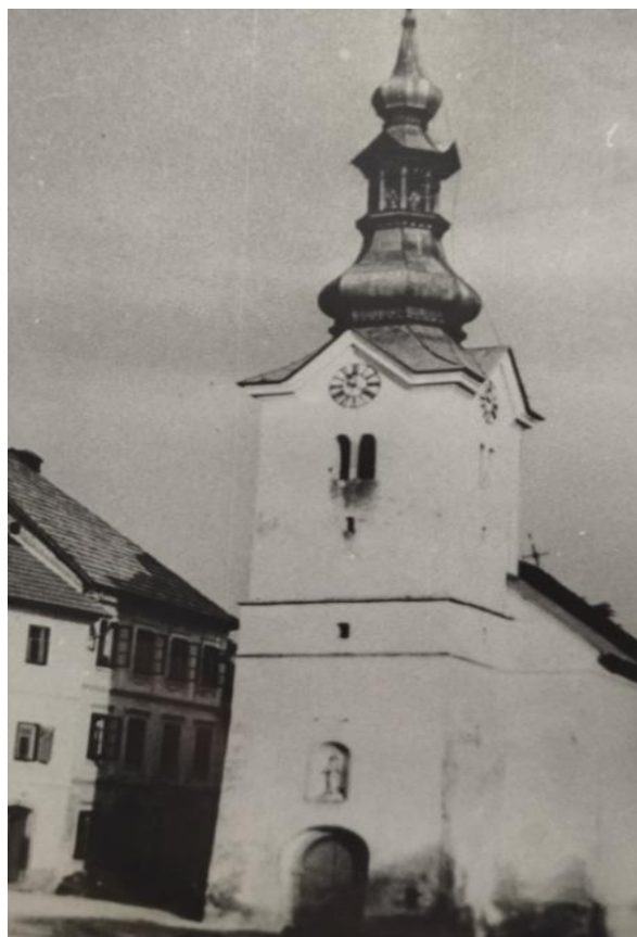
Del Žužemberka, ki ga ni več

Spomladi so Nemci začeli izvajati novo veliko ofenzivo, ki jo označujemo kot sedmo sovražno ofenzivo proti NOVJ. Sovražnik je naperil svoj ofenzivni sunek proti območju VII. korpusa. Nemci so kot svojo udarno silo uporabili predvsem na novo izurjene in sveže enote slovenskih domobrancev, ki so 20. aprila 1944 na ljubljanskem stadionu svečano zaprisegli in obljubili zvestobo Adolfu Hitlerju in nacistični Nemčiji.