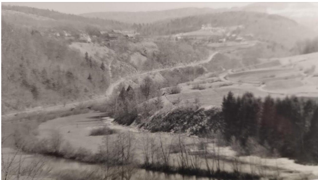
Dolina Krke od Žužemberka proti Dvoru

Po padcu Žužemberka je sovražnik ponovno poskušal zagospodariti nad izgubljenim ozemljem. Žužemberk in njegovo območje ter vsa dolina Krke od Soteske navzgor sta bila celo leto 1944 cilj pogostih domobransko-nemških vdorov. Tako so se 6. maja ob 15. uri pojavili v Žužemberku domobranci, a so se v nočnih urah na nedeljo umaknili. 8. maja so partizani zažgali oba zvonika pri farni cerkvi, da so sovražniku preprečili ponovno ureditev mitraljeških gnezd.