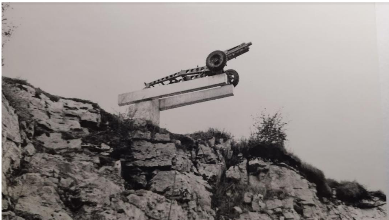
Spomenik partizanskih topničarjev

V spopad je na sovražni strani posegla tudi artilerija. Dvanajst letal je bombardiralo in mitraljiralo partizanske položaje. Pri tem so hudo prizadeli vas Reber, ki je bila skoraj v celoti porušena, precej škode pa je utrpela tudi vas Zafara. Sovražnik je z vseh strani poskušal priti obleganim na pomoč, toda vse zaščitne enote so se ogorčeno borile proti tem kolonom. Edino motorizirani koloni iz Novega mesta je s podporo tankov uspelo prodreti prek Ajdovca do Žužemberka in okrepiti garnizijo.