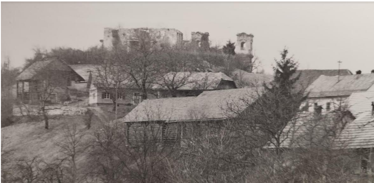
Zafara, v ozadju župnišče in cerkev

VII. korpus je po sovražnikovem sunku takoj pregrupiral svoje sile in 30. aprila s XV. divizijo udaril v sredo sovražnega razporeda na postojanki Dobrava in Dobrnič ob cesti Žužemberk–Trebnje. Z likvidacijo teh vmesnih postojank je bilo partizanom omogočeno, da so obkolili Žužemberk.