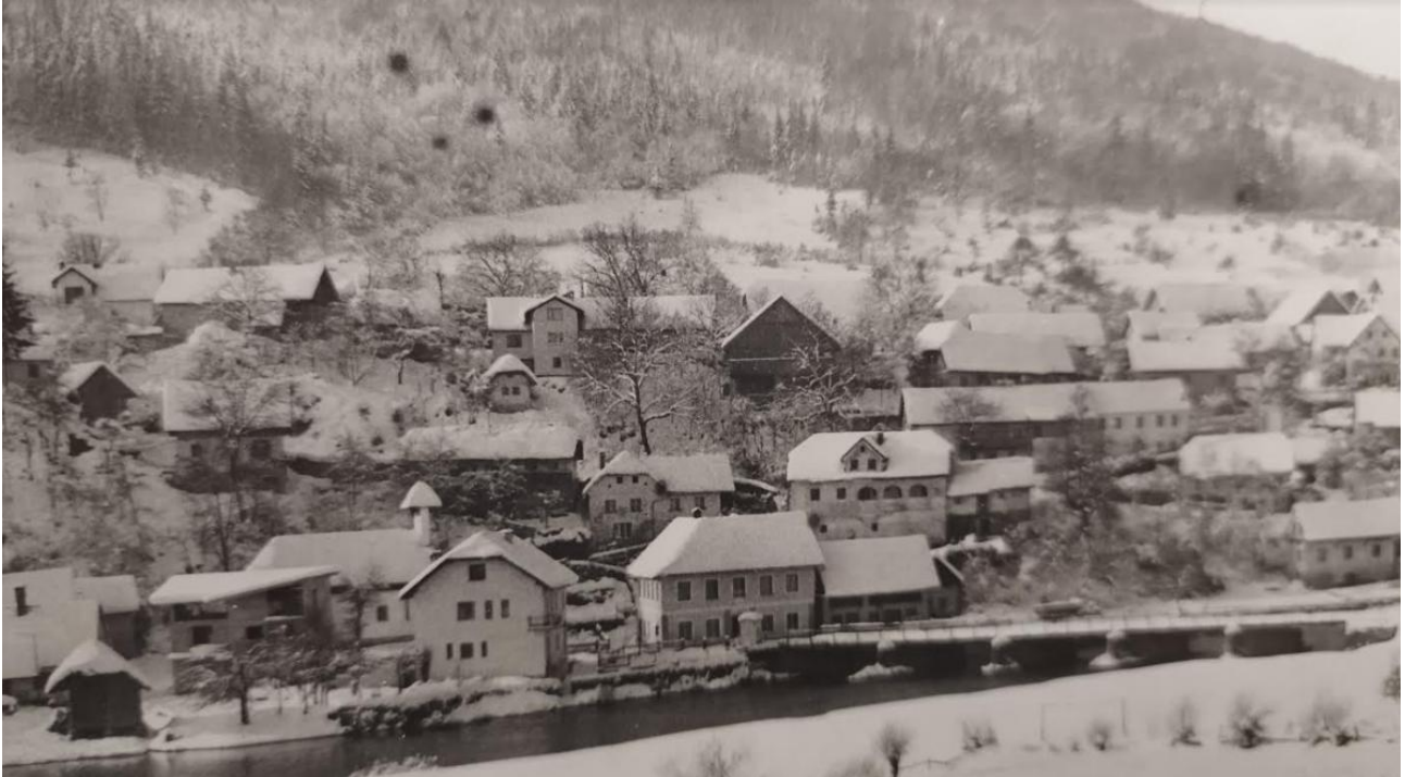
Žužemberk – desni breg