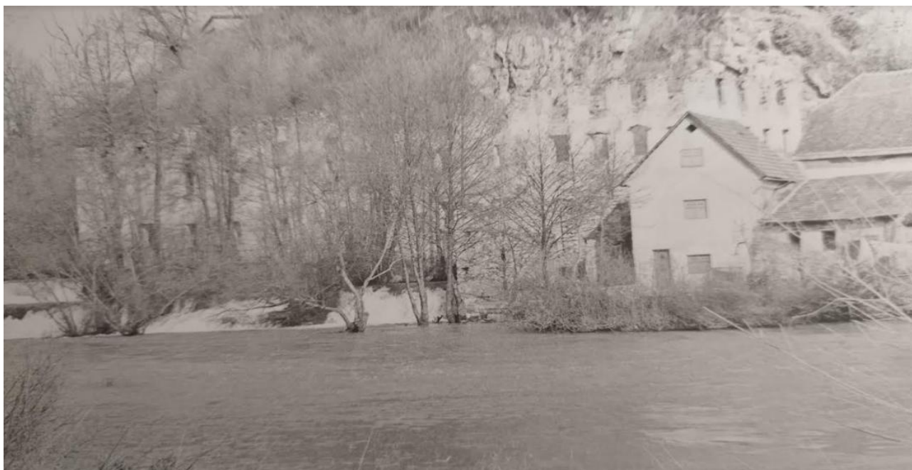
Usnjarna pod gradom

Žužemberk je postal važno oskrbovalno središče. V začetku leta je bilo v kraju več obrtnih delavnic, ki so delale za partizansko vojsko in za civilno prebivalstvo. Ker je bilo pomanjkanje tobaka, so partizani 15. januarja tudi kadilcem civilistom delili cigare in tobak.