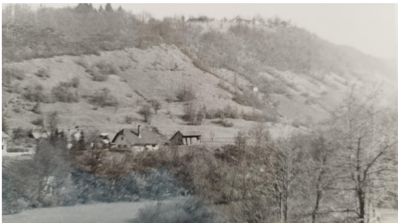
Del Dvora, v ozadju Vinkov vrh

9. aprila so bataljoni 5. in 12. brigade ter jurišni bataljon XV. divizije, ki so v noči na 9. april prišli na levi breg Krke, napadli sovražno postojanko na Vinkovem vrhu, Velikem in Malem Lipovcu, Mačkovcu in Sadinji vasi. Po topniškem ognju, ki se je začel ob 6.30, je jurišni bataljon zavzel Vinkov vrh.