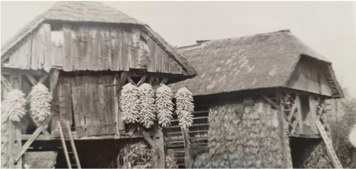
Tudi seniki in kozolci so dajali zavetje utrujenim borcem

8. februarja so bile enote XVIII. divizije v hudih bojih na odseku Dvor–Jama–Stavča vas, jurišni bataljon pa je zopet napadel sovražne položaje pri Stranski vasi.