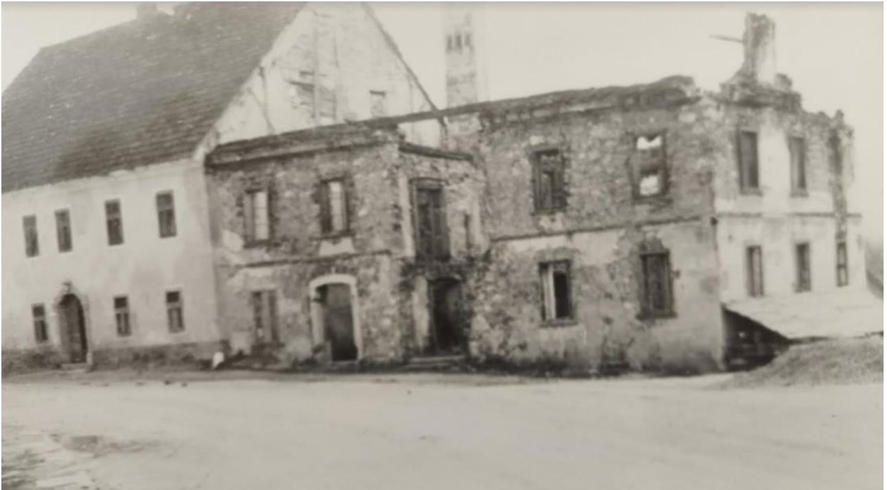
Porušena hiša na trgu

10. aprila so se v Suhi krajini še bolj razplamtele krvave borbe. Petnajst letal je ponovno bombardiralo Žužemberk.