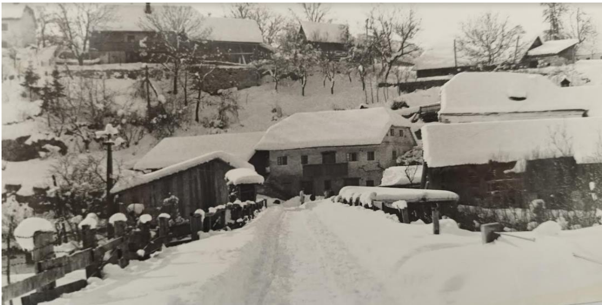
Jama pri Dvoru, most čez Krko

1. februarja je 19 zavezniških letal z bombami in ognjem iz strojnic napadlo sovražno postojanko v Žužemberku, naslednjega dne pa so letala ponovno z raketnimi bombami obstreljevala sovražno postojanko v žužemberškem gradu. Istega dne je 8. brigada odbila sovražni izpad iz Stranske vasi.