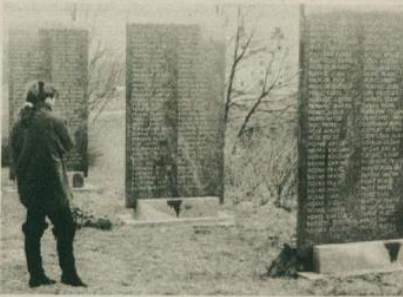
SPOMIN - Del spomenika NOB na Cviblju pri Žužemberku

Odbor za informiranje pri občinskem odboru ZZB Novo mesto