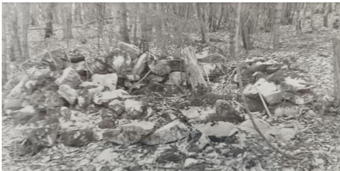
Ostanki bunkerjev na Jesenovi bojni črti

bunkerje in v njih pričakali sovražnika. Ponoči z 21. na 22. februar je prišlo v Stransko vas mnogo vojakov, največ Čerkezov.