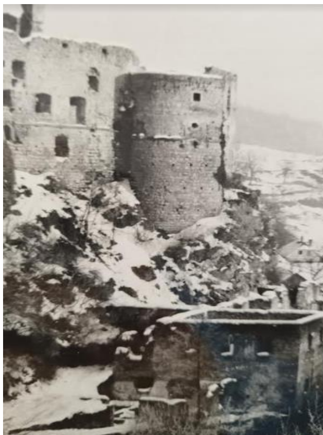
Usnjarna pod gradom