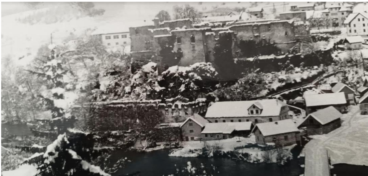
Žužemberk, levi breg, grad in ostanki usnjarne

Leta 1945 je šlo Nemcem samo še za to, da prek slovenskega ozemlja omogočijo umik svojih armad iz Bosne in Hrvaške. Bojne sile obeh strani so bile v Sloveniji v začetku leta v glavnem iste kot v drugi polovici leta 1944, samo Nemci so dobili nekaj okrepitev.