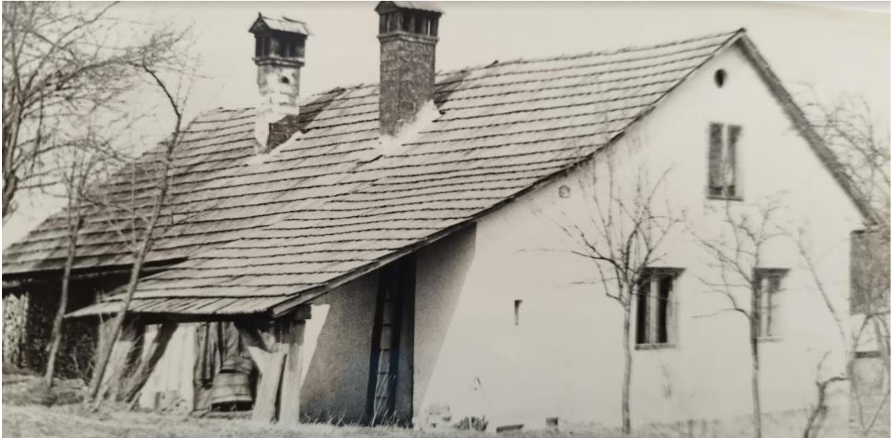
Hiša na desnem bregu Krke v Žužemberku, v katero so zapirali ujete skojevke