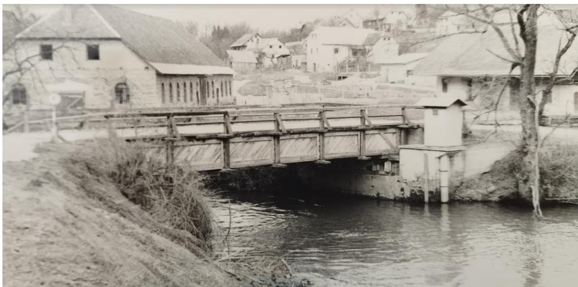
Most preko Krke na Dvoru

1. januarja je sovražnik ponoči s streljanjem vznemirjal partizane na desnem bregu Krke. 2. januarja se je poveljstvo mesta nastanilo v Cegelnici, 3 km od Žužemberka v smeri proti Dvoru, na desnem bregu Krke.