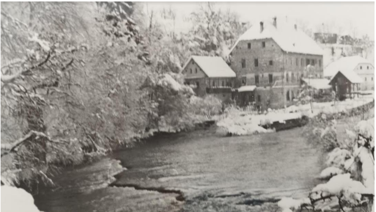
Jama pri Dvoru

10. februarja je Cankarjeva brigada napadla sovražnika v Stranski vasi. Sovražnika so napadali tri dni in ga zasuli z minami »partopov«, ki so jih izdelovali partizanski orožarji v Starih Žagah. Toda vsi napori so bili zaman. Čeprav so Nemci in domobranci utrpeli hude izgube, niso zapustili postojanke.