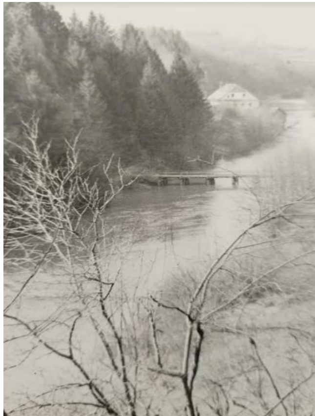
Most čez Krko pod transformatorjem

11. aprila je šestnajst zavezniških letal močno bombardiralo Žužemberk in porušilo več hiš.