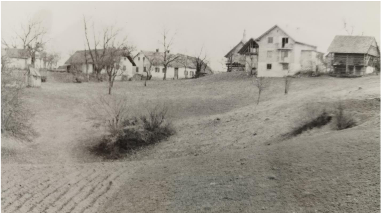
Stranska vas, pogled z zahoda

10. februarja je Cankarjeva brigada napadla sovražnika v Stranski vasi. Sovražnika so napadali tri dni in ga zasuli z minami »partopov«, ki so jih izdelovali partizanski orožarji v Starih Žagah. Toda vsi napori so bili zaman. Čeprav so Nemci in domobranci utrpeli hude izgube, niso zapustili postojanke.