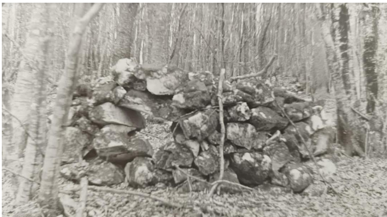
Ostanki bunkerjev na Primožu

Na Jesenovi bojni črti so si partizanski borci zgradili prave bunkerje, saj jim kamenja in lesa ni primanjkovalo. Stene bunkerjev so bile več kot meter debele in prav toliko visoke, na stene iz kamenja pa so borci polagali hrastova debla, ki so jih na debelo posipali s kamenjem. V zidovih so zijale odprtine – strelske line.