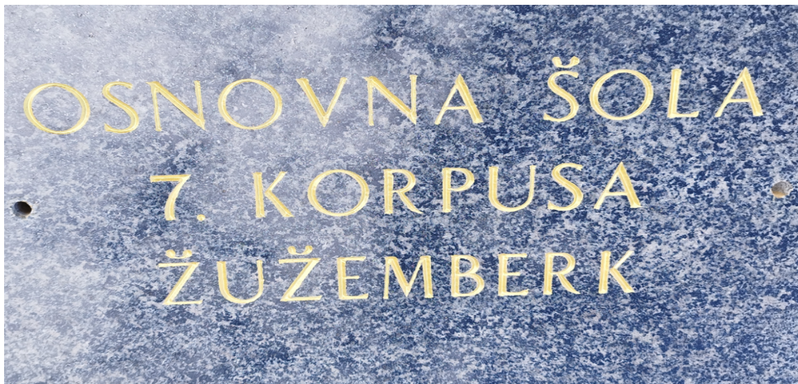
Tabla, ki je bila do leta 1991 na pročelju šole