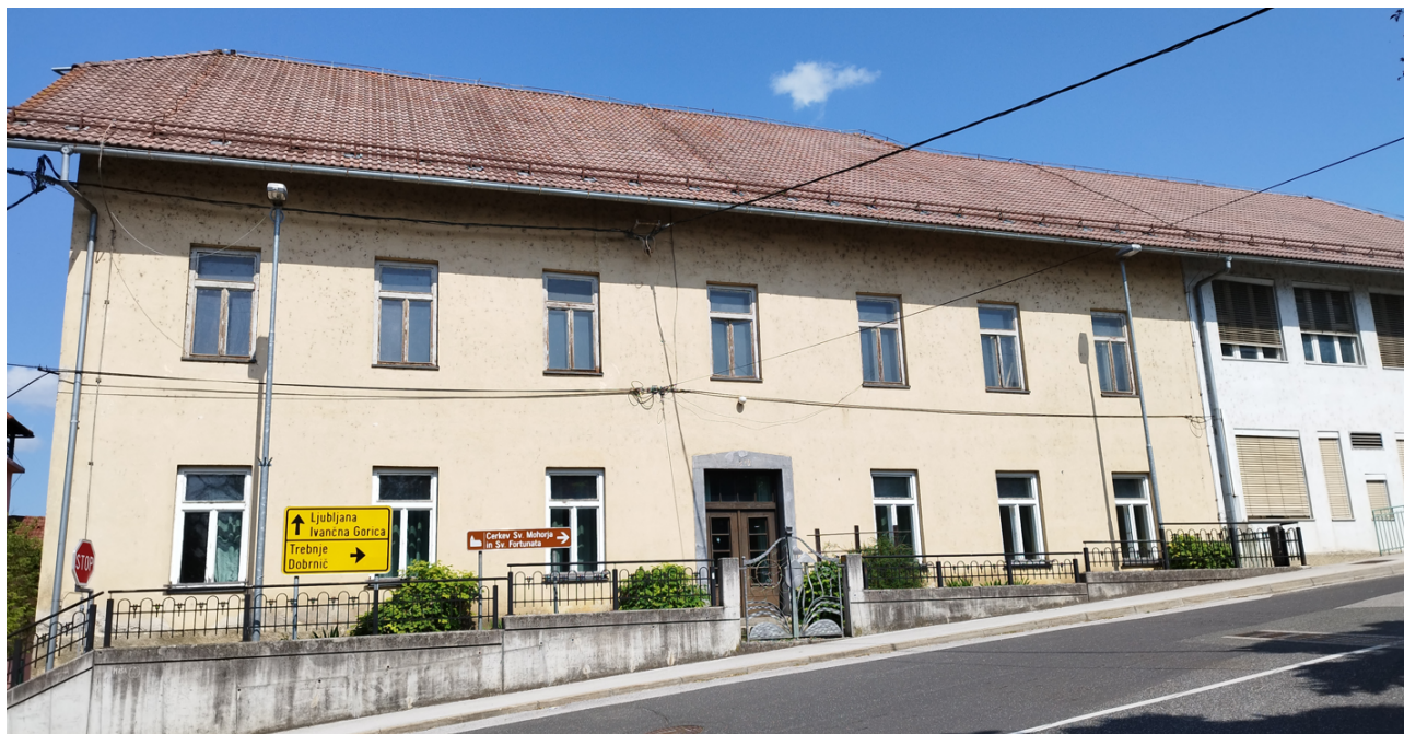
Stari del osnovne šole Žužemberk; tabla z napisom Osnovna šola 7. korpusa Žužemberk je odstranjena.

Vir: Zrimec S., Gibanje prebivalstva Slovenije v razdobju 1931–1948 .