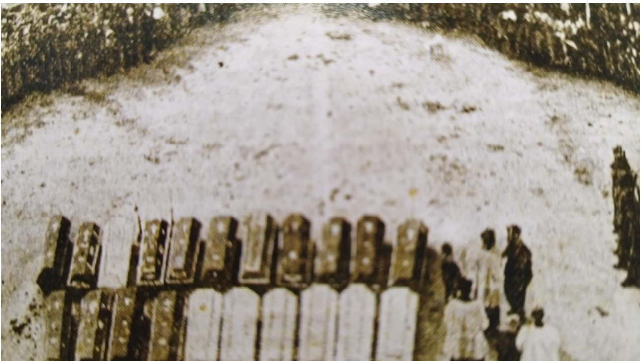
Pokop umorjenih 3. junija 1945

Vir: Grgič.S, (1997), Zločini okupatorjevih sodelavcev, 2. knjiga. Društvo piscev zgodovine NOB Slovenije v Ljubljani, Tiskarna Novo mesto