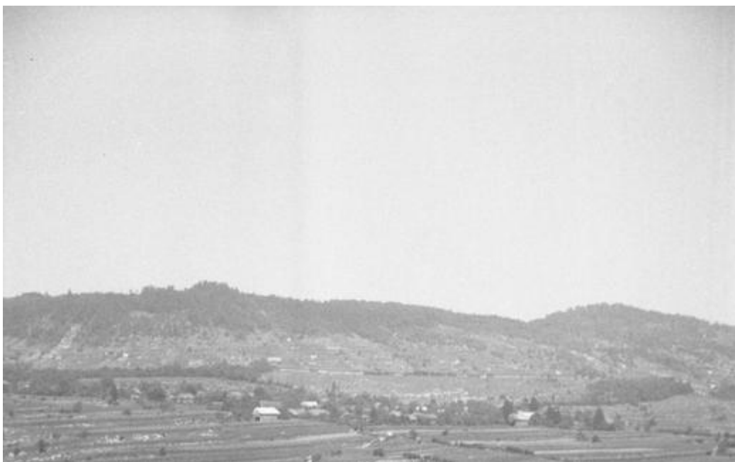
Gradenc pred 2. svetovno vojno